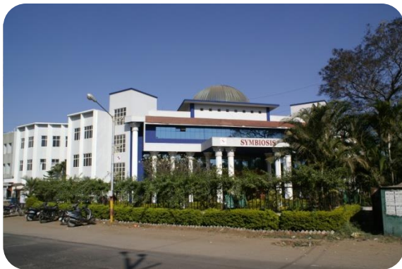
研修会場のSymbiosis International University SIMS(Symbiosis Institute of Management Studies) キャンパス外観