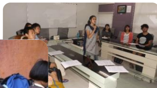
インド人講師によるクラスの様子